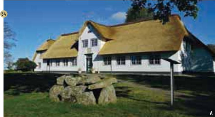
Sylt Museum: Neben Sylter Geschichte werden in den Galerieräumen wechselnde Kunstausstellungen präsentiert. Näheres zu den aktuellen Kunstausstellungen erfahren Sie in der Tagespresse.