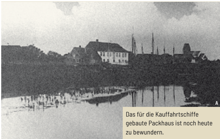
Das für die Kauffahrtschiffe gebaute Packhaus ist noch heute zu bewundern.

→ Laufen Sie hinunter zum Watt (zunächst fester Kiesweg, dann Asphaltweg direkt am Watt) und unterhalb des Kliffs Richtung Morsum ca. 1,8 km bis zur Straße Am Tipkenhoog . Hier finden Sie den alten versandeten Hafen und das Packhaus von Keitum (Punkt 8) und 100 m weiter das »Altfriesische Haus seit 1640« (Punkt 9)