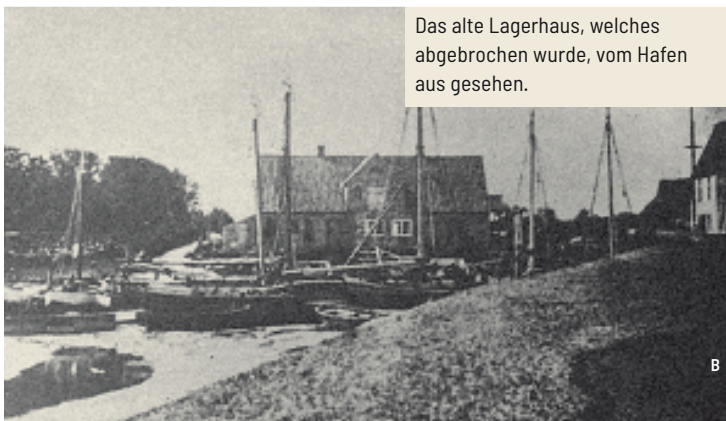
Das alte Lagerhaus, welches abgebrochen wurde, vom Hafen aus gesehen.